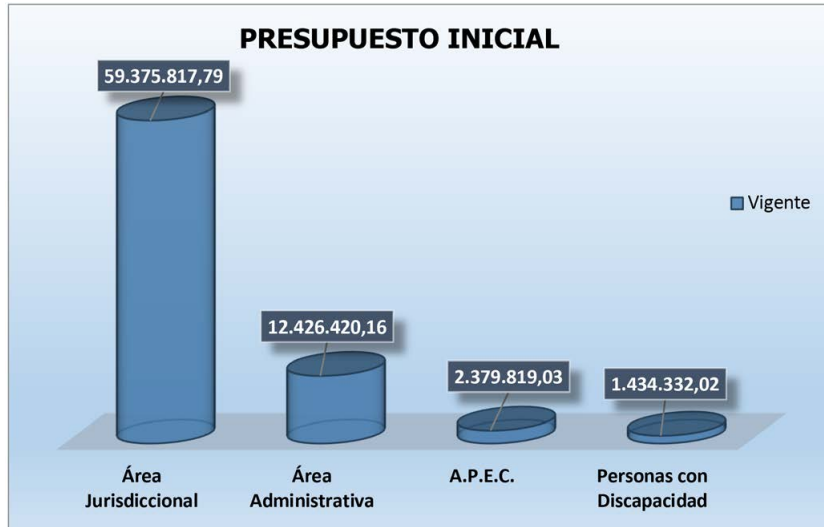
GRÁFICO N°1 PRESUPUESTO POR CATEGORÍA PROGRAMÁTICA